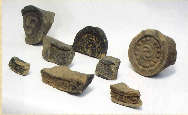
「台山3次発掘調査出土瓦」 江戸時代 (17世紀頃) 杵築市教育委員会蔵