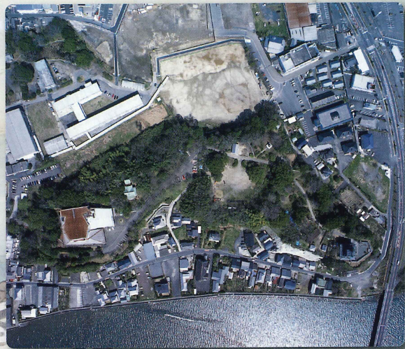
杵築城上空写真（台山部分）