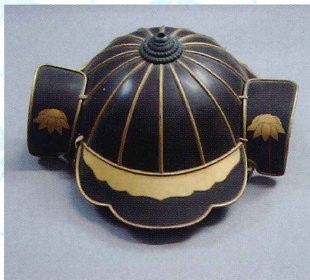
「藩主着用 雪笹紋入り火事兜」 江戸時代 杵築神社蔵 (寄託品)