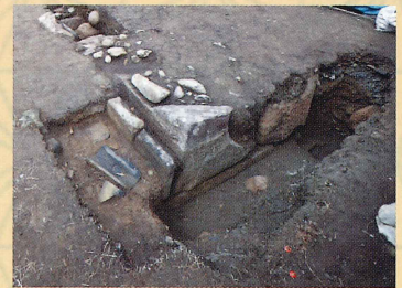
天守南側石垣調査状況