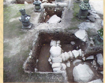
虎口空堀及び破却後の石積み付近調査状況