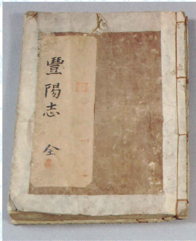
木付氏の子孫が大友家没後の128年後に記した文献資料 「豊陽志(写本)」 江戸時代 個人蔵 (寄託品)