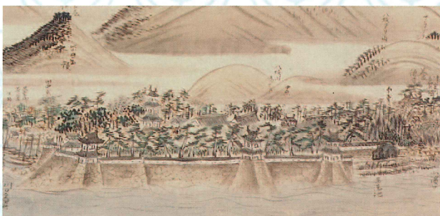
「田辺文琦筆 旧杵築藩之真景(部分)」 嘉永3年 [1850] 個人蔵 (寄託品)