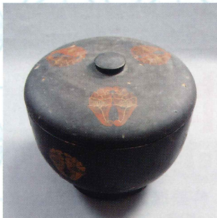
「抱き花杏葉紋入り飯櫃」 江戸時代 個人蔵 (寄託品)