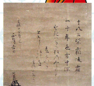
「松平英親侯御筆 春詠歌」 元禄14年 [1701] きつき城下町資料館蔵