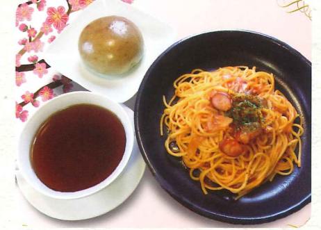
図 8:00～21:00 ☎0978-62-3984 図毎週火曜日