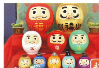
杵築市杵築129 ☎なし 開 10:00~16:00 休 木曜 休 なし

県内の作家様の作品を販売しています。ひいなめぐり限定の各種ワークショップを行っていますので、ぜひお気軽にお立ち寄りください。