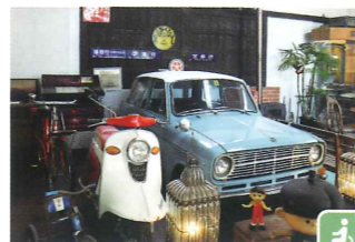
杵築市杵築多門6-2 ☎0978-63-5228 開 10:00~17:00 火曜 休 大人500円(着物の方300円) 中学生まで300円 共同P利用

館内では重厚な市松人形、子どもの頃お友達と遊んだ人形ごっこ、まごごとごこを思い出してもらえる品々にぎわっています。温かい飲物を準備してお待ちしています。