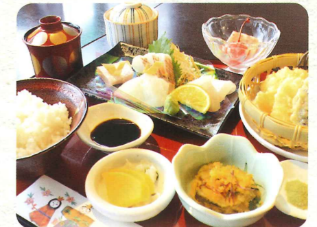
図11:00～15:00 / 18:00～22:00(きつき衆楽館 2F) ☎080-2770-9337 図毎週水曜日