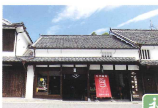
杵築市杵築169 ☎0978-62-2169 開 8:00~19:00 休 1/1~1/3 共同P利用

味噌づくりを許屋の坂下で代々営む「綾部味噌」では、九代杵築藩主作の屏風と江戸後期の箱雛から昭和にかけての雛人形を展示しています。