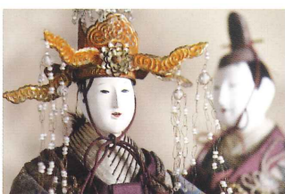
杵築市杵築329 ☎0978-62-2007 開 9:00~17:00 (入館は16:30まで) 休 年末年始 休 大人150円 小人80円 共同P利用

代々町医者が藩医も務めた佐野家は城下町で最も古い木造建築物です。悠久の年月を過ごした佐野家伝来の雛が今年も貴方をお待ちしています。