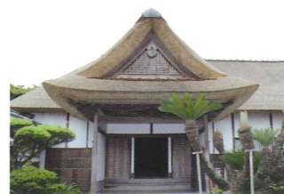
杵築市杵築207 ☎0978-63-4554 開 9:00~17:00 (入館は16:30まで) 休 なし 休 一般300円・小中学生150円 共同P利用

家老屋敷として、その暮らし向きや風情が今でも漂う貴重な建築遺産です。期間中、屋敷内には様々なひな人形が飾られます。週末は呈茶席をもうけています。