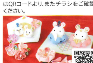
杵築市南杵築193-1 ☎0978-62-3402 開 9:00~16:00 (入館は15:30まで) 休 月曜(開館中は臨時閉館) 休 無料 共同P利用

期間中、七島蘭の実演販売やあみもの展示、さおり織り体験、水引体験など県内の作家さんによるコーナーを準備してお待ちしております。イベント内容はQRコードより、またチラシをご確認ください。