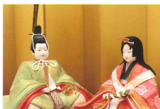
杵築市杵築211-1 ☎0978-63-1488 開 9:00~17:00 (入館は16:30まで) 休 12/29~1/3 休 一般300円 小中学生150円 共同P利用

藩主の休憩所として設けられた御用屋敷に木目込み人形を展示しています。その中には、優しい顔の物から価値ある物まで展示されますので、ぜひお立ち寄りください。