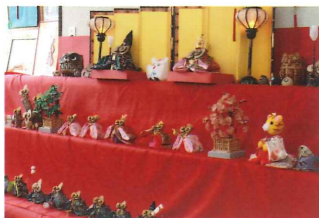
杵築市杵築692-4 ☎080-6462-6566 開 10:00~15:00 休 なし 共同P利用

雛の創作人形や施設名の「福ろう」にちなんだ木工の雛人形が飾られ、手作りのパンや加工品などを販売しています。