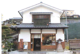
杵築市杵築173 ☎0978-62-2223 開 8:30~18:30 休 年中無休 共同P利用

塩屋の坂下で古くから続く「松山堂」では、昭和中期の御殿雛を展示しています。銘菓「三万二千石」やひいなめぐり限定の味の和菓子をご賞味ください。