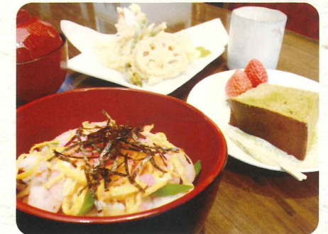
図10:00～22:00 ☎0978-63-3228 図毎月第2火曜日

MAP D ひいなセット(甘酒・抹茶ケーキ付) 茶房 一番館 1,100円(税込)