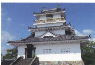
杵築市杵築16-1 ☎0978-62-4532 開 9:00~17:00 (入館は16:30) 休 なし 休 大人400円 小人200円 共同P利用

昭和初期の八坂家、堀家のひな人形など展示も多彩です。また、天守閣から見る景色は、守江湾が一望できる絶景です。