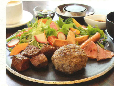
図11:00～14:30(LO14:00) ☎0978-63-4381 図不定休

MAP F おおいた和牛使用 よくばりお肉とたっぷり野菜プレート 芳の芽 1,650円(税込)