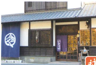
杵築市杵築191 ☎0978-62-2144 開 10:00~17:00 休 不定休 共同P利用

中井家伝来の雛人形の展示とともに、和の小物の展示と販売をしています。特産品やお土産も扱っております。