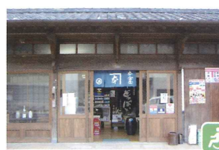
杵築市杵築178 ☎0978-62-2045 開 8:00~19:30 休 なし 共同P利用

杵築城下で地酒の品揃えが豊富な酒屋として、代々親しまれています。古い雛人形や版画絵を展示し、酒粕など色々なものを販売しています。