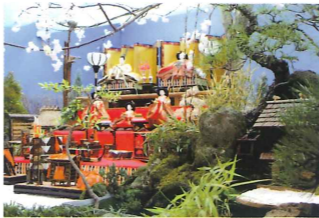
杵築市南杵築193-1 ☎0978-62-5761 開 9:00~17:00 (入館は16:30まで) 休 12/29~1/3 休 一般150円 小中学生80円 共同P利用

いつか見た山河の情景が室内に施される座敷雛は、必見です。また、手づくり雛を中心に古布・古布小物なども多数販売しています。