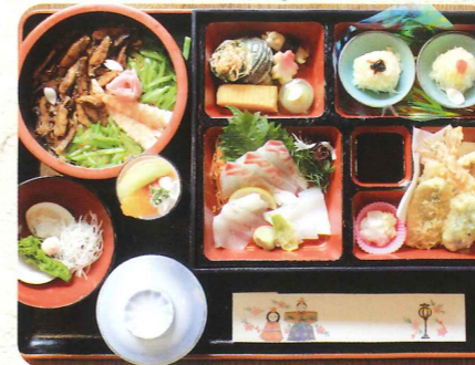
図11:00～15:00 / 18:00～22:00 ☎0978-62-5300 図毎週火曜日