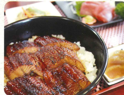
図11:00～14:00 ☎0978-68-8971 図毎週日曜日