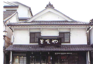
杵築市杵築385 ☎0978-62-2139 開 9:00~19:00 休 なし 共同P利用 休 10席(抹茶体験など予約は10名まで)

杵築初の国指定登録有形文化財になった商家を代表するお茶の老舗の奥敷にひな人形を飾ります。ひな菓子やひな菓子の販売もします。和風喫茶コーナーで一服どうぞ。