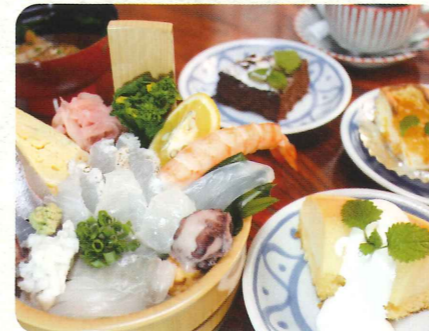
図11:00～14:00 / 17:00～22:00 ☎0978-63-6771 図不定休

MAP F おおいた和牛使用 よくばりお肉とたっぷり野菜プレート 芳の芽 1,650円(税込)