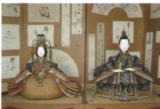
杵築市杵築395 ☎0978-62-2809 開 9:30~17:00 休 なし 共同P利用

享保期のひな人形と100年前の木目込み人形、昭和初期の八重垣姫(特大)を展示しています。また昔の城下町や四季折々の美しい写真も展示し、古布木炭などを販売しています。