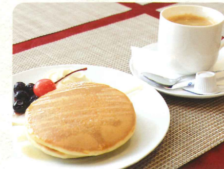
図11:00～16:30 ☎0978-62-5087 図毎週火曜日