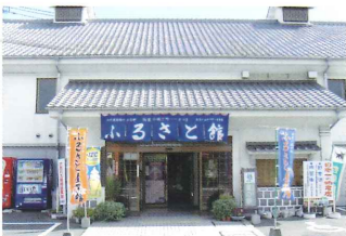
杵築市杵築665-172 ☎0978-62-2000 開 9:30~17:30 休 12/31~1/2 共同P利用

お土産に喜ばれる地元の特産品などを販売しています。店内にはひな人形を展示し、みなさまをお迎えしています。