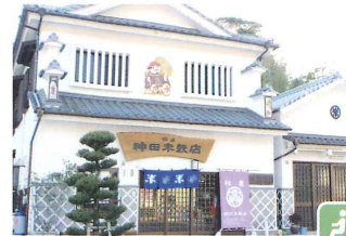
杵築市杵築182 ☎0978-62-2215 開 8:00~18:00 休 なし 共同P利用

雛にまつわる掛軸の展示や米袋を使った段飾りを展示します。寒い季節に好評の霧しなそば(乾麺)も販売しています。