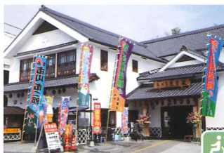
杵築市杵築398-1 ☎0978-66-1112 開 9:30~17:00 (土日祝日は21:00まで) 休 35席 休 月未最終日と月1回(不定休) 共同P利用

江戸大衆娯楽を現代に伝える当館は、大正期の酒蔵を改修した劇場です。館内では雛展示と共に食事処や土産品店を常設。お気軽にお立ち寄りください。