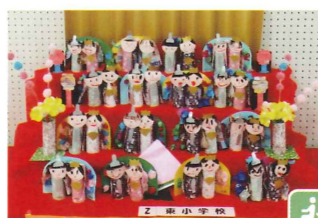
杵築市杵築126-1 ☎0978-62-2499 開 9:00~17:00 休 なし 共同P利用

市内の子ども達が手作りで作った雛人形のコンクールを行っています。大人の部の作品も展示し、創作雛ならではのかわいらしさをご覧ください。