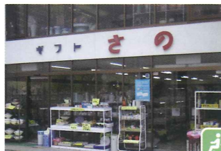
杵築市杵築665-166 ☎0978-62-5897 開 10:00~17:00 休 火曜 共同P利用

城下町杵築で、代々続く最も古いとされる商家「岡野屋」伝来の文化・文政期の雛人形を多種多様な陶器の品々とともに展示しています。