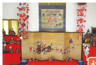
杵築市杵築208-1 ☎0978-62-0330 開 10:00~17:00 (LO16:00) 休 なし/台の茶屋(毎週水曜休み) 休 20席 共同P利用

能見邸内に併設されている甘味処の茶屋では、ひいなめぐり期間限定のメニューをご用意して皆様のお越しをお待ちしています。