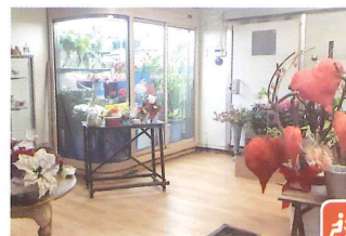
杵築市杵築421 ☎0978-62-2011 開 10:00~16:30 休 なし 共同P利用

城下町杵築で40年近く生花店を営んでいます。お花を通して人との縁を大切にしています。お花で飾ったひなをぜひご覧くださいませ。