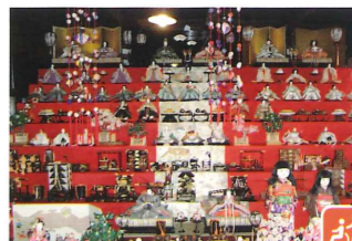
杵築市杵築400 ☎0978-62-2539 (杵築市商工会) 開 10:00~16:00 休 なし 共同P利用

南台武家屋敷へ続く天神坂下の「土谷商店」では幕末から平成までのお雛様等を展示し、店内では土日限定で甘味も販売しております。(最終週は展示のみ)