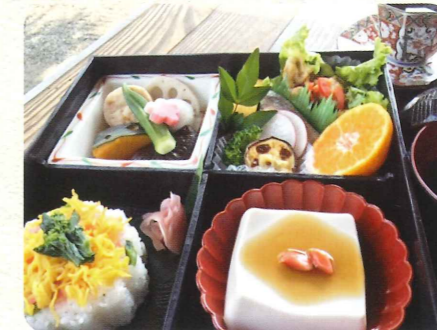
図10:00～16:00 ☎0978-62-0330 図毎週水曜日 ※5名様以上は要予約

MAP D ひいなセット(甘酒・抹茶ケーキ付) 茶房 一番館 1,100円(税込)