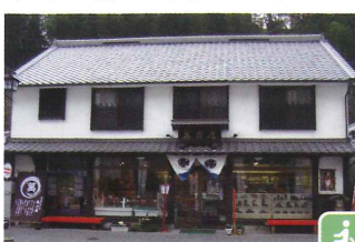
杵築市杵築157 ☎0978-62-3060 開 8:00~19:00 休 無休

木の温もりを感じる店内で、明治・昭和の雛を展示しています。手作りの可愛い和の小物も品揃えし、繊細で情緒あふれる箱庭がお出迎えします。