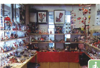
杵築市杵築152 ☎0978-62-3016 開 9:00~16:30 休 なし 共同P利用

手作りひな人形、つるし飾り、タペストリー、和の小物多種類色々取り揃えています。週末はお買得商品を多数取り揃えていますのでお気軽にお越しください。