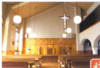
杵築市杵築296番地 ☎0978-63-3300 開 9:00~17:00 休 日曜 共同P利用

創立130年を迎えた教会です。神様の愛で育む幼稚園では子どもの健やかな成長を願ひ雛人形の展示をしています。