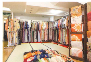
杵築市杵築372-4 ☎0978-63-1210 開 10:00~16:00 (着付14:00 返却16:00) 休 年末年始 共同P利用

きものに着てすぐに撮影できるような展示でお客さまをお迎えしています。ひいなめぐりのスタートはまず和楽庵で!!