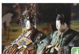
杵築市南杵築193-1 ☎0978-62-5750 開 9:00~17:00 (入館は16:30) 休 月曜(開館中は臨時閉館) 休 大人300円 小人150円 共同P利用

藩主ゆかりの雛人形をはじめ、旧家後藤家などの雛を展示しています。先人たちの残した貴重な文化財から杵築の歴史や文化をわかりやすく紹介しています。