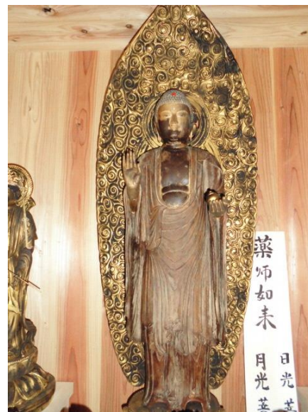
東光寺薬師如来像（非公開）