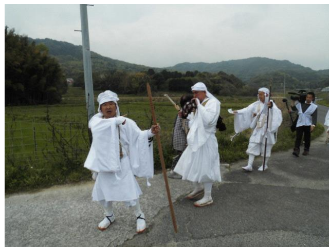
横城より降りる修験僧